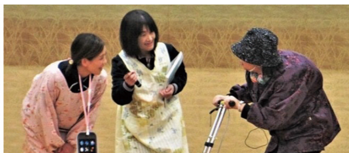
声掛け訓練のデモンストレーションの様子

田村市地域包括支援センターは「認知症にやさしい地域づくり」に力を入れて業務にあたっています。今年度は、地域の運動サロンに出向いての認知症サポーター養成講座の中で、徘徊者に対する声掛け訓練も行っています。認知症に関する相談も対応しておりますので、お気軽にご相談ください。